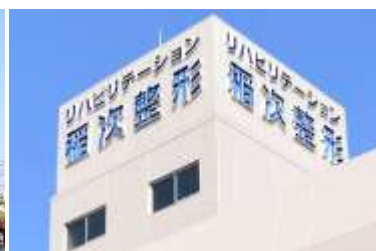
高松赤十字病院 吉野川医療センター 連携施設