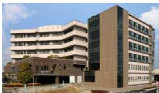
きたじま田岡病院 連携施設