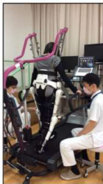
徳島病院でのロボットリハビリテーション