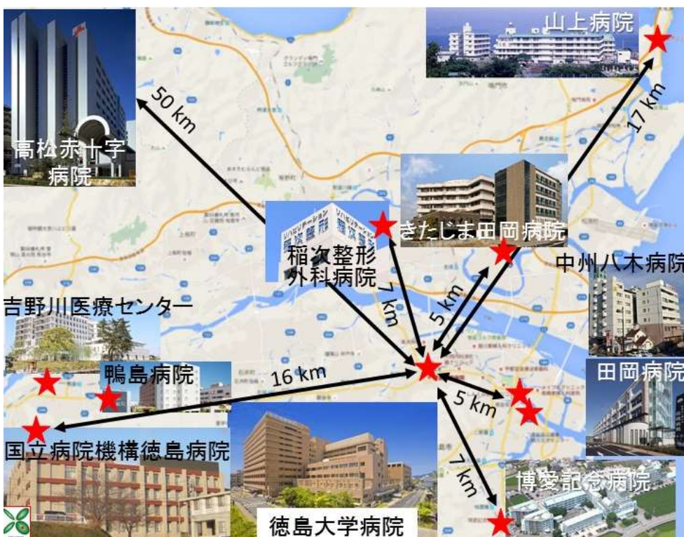
図1 徳島大学病院と 連携・関連施設