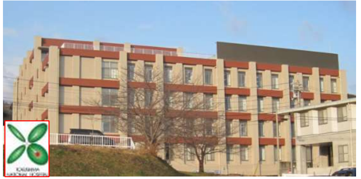
国立病院機構徳島病院