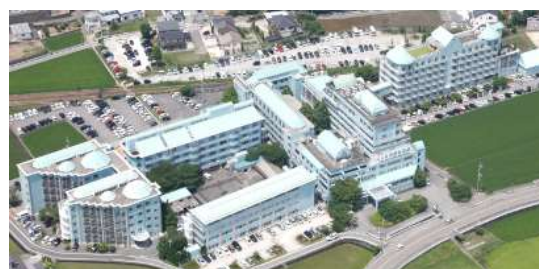
鳴門山上病院 博愛記念病院