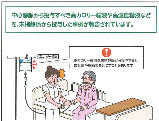
No.209 中心静脈から投与すべき輸液の末梢静脈からの投与